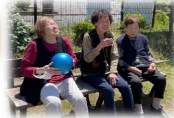
公園でボール遊び