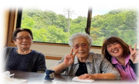
「漁火大名」と種松山