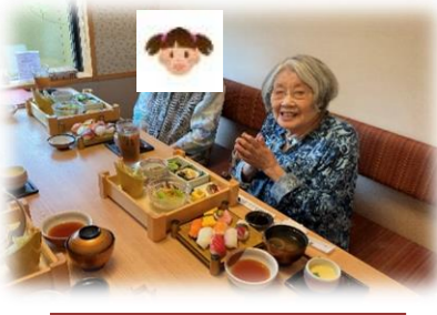
「遊食房屋」・種松山