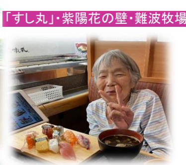
「すし丸」・紫陽花の壁・難波牧場