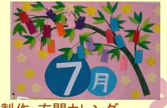
製作：玄関カレンダー