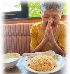
「きびきび亭」・安養寺