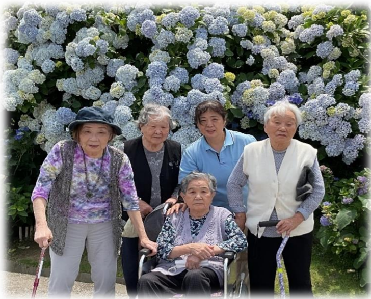
「結」・紫陽花の壁・難波牧場