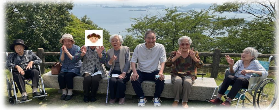
王子が岳 パラグライダーが飛んでいました